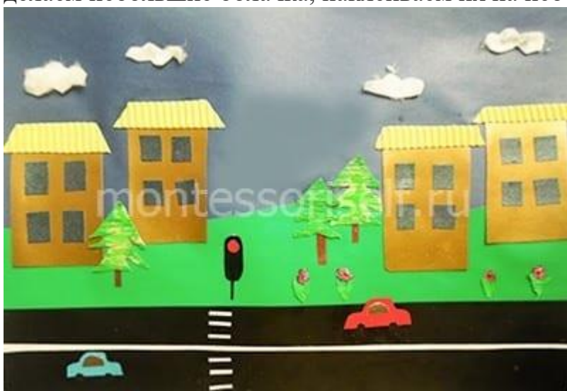
Цветы и облака

Остается украсить наш урбанистический пейзаж : из цветной бумаги вырезаем цветочки, высаживаем их на газон. Из белой бумаги, салфетки или ватных дисков делаем небольшие облачка, наклеиваем их на небо.